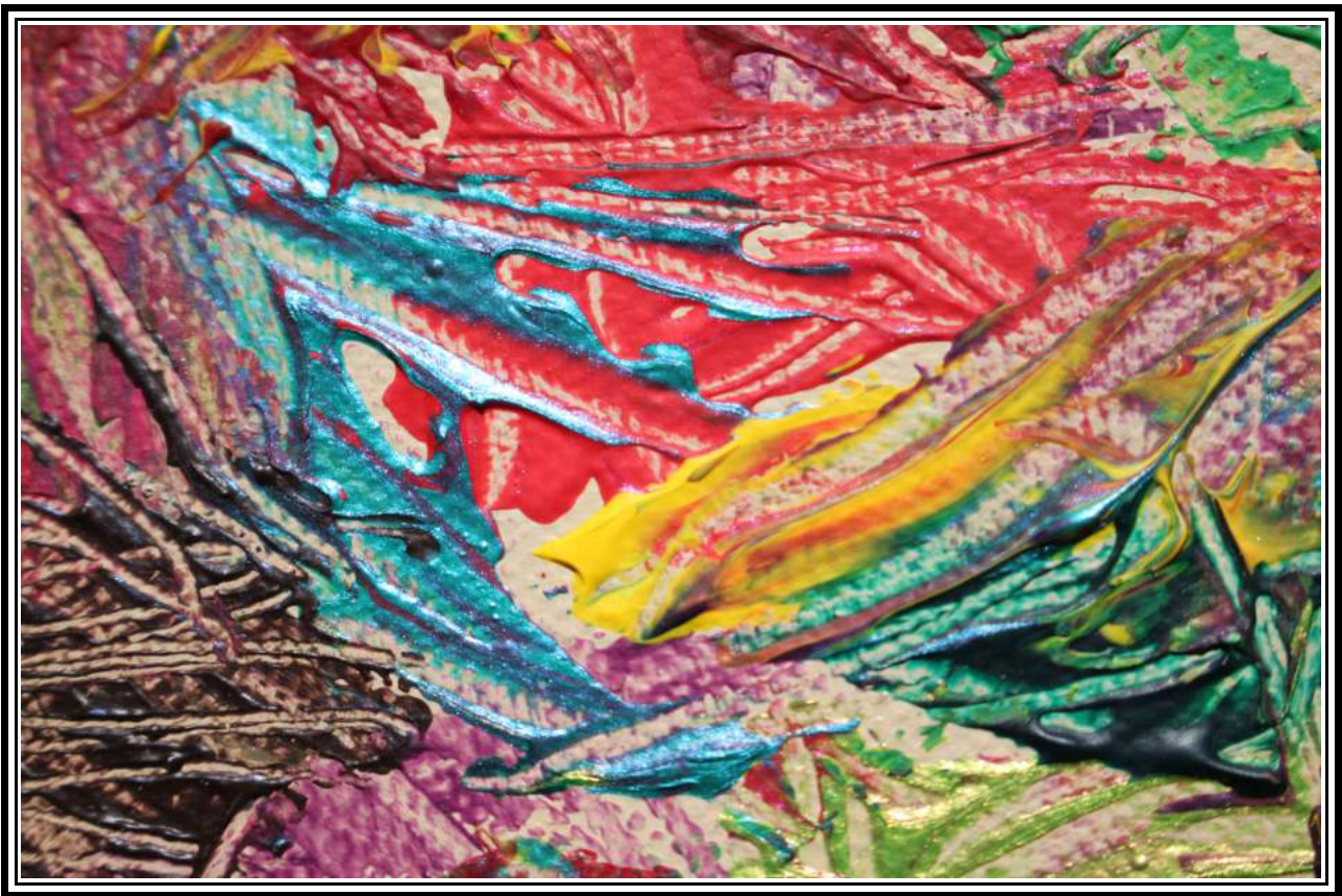
Peinture : Curtis Efoua

Emilie Calmé Flûtes Laurent Maur Harmonica Ouriel Ellert Basse électrique Curtis Efoua Batterie