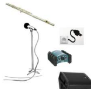
Plan de scène